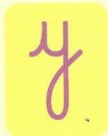
Une petite étrécie. Un jambage bouclé.

1 Repasse vivement au crayon plusieurs fois de suite la lettre tracée en bleu.